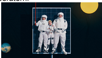
Eine Reise durch die Swiss Life-Gruppe

Die Swiss Life Holding AG mit Sitz in Zürich geht auf die 1857 gegründete Schweizerische Rentenanstalt zurück. Die Aktie der Swiss Life Holding AG ist an der SIX Swiss Exchange kotiert (SLHN). Zur Swiss Life-Gruppe gehören auch die Tochtergesellschaften Livit, Corpus Sireo, Beos und Mayfair Capital. Die Gruppe beschäftigt rund 8600 Mitarbeitende und verfügt über ein Vertriebsnetz mit rund 14 000 Beraterinnen und Beratern.