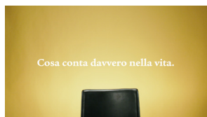
Cosa conta davvero nella vita