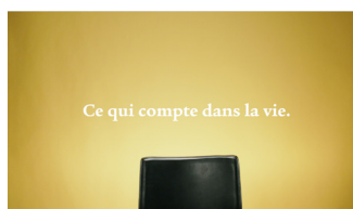
Ce qui compte dans la vie