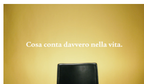
Cosa conta davvero nella vita