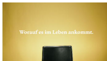
Worauf es im Leben ankommt