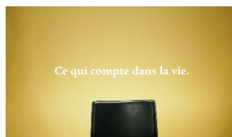
Ce qui compte dans la vie